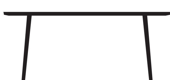
Dining Table 180 x 90 cm